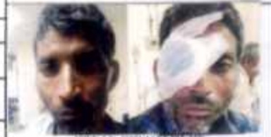
PASTE PHOTO HERE

FATHER'S/SPOUSE'S NAME: Sugriv पिता/कटुम्भ का नाम